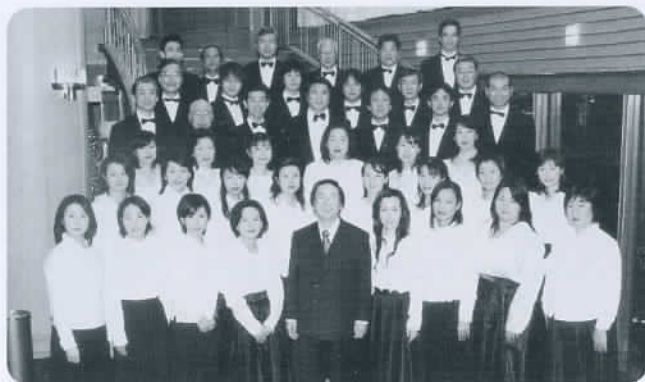
モーツァルト記念合唱団