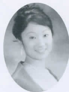
ナレーション・平橋佳代子