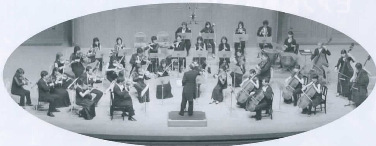
モーツァルト室内管弦楽団